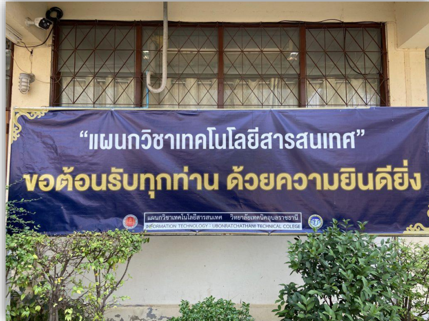
อาคารแผนกวิชาเทคโนโลยีสารสนเทศ