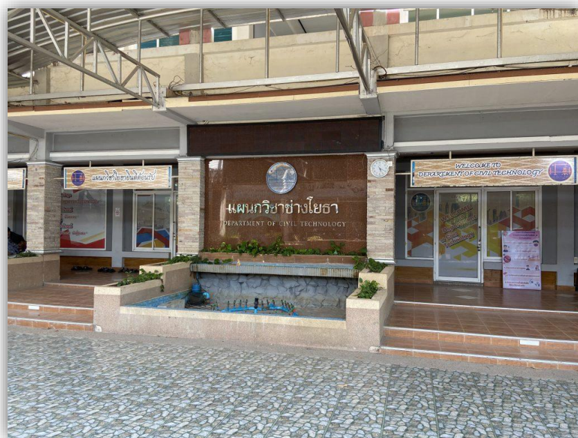
อาคารแผนกวิชาโยธา