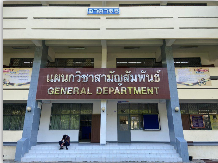
อาคารแผนกวิชาสามัญสัมพันธ์