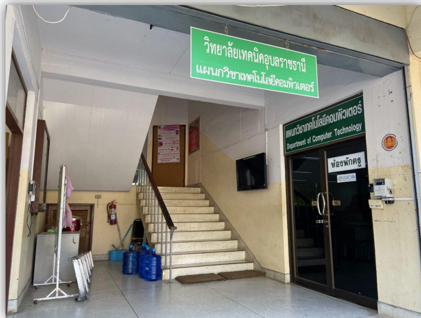
อาคารแผนกวิชาเทคโนโลยีคอมพิวเตอร์