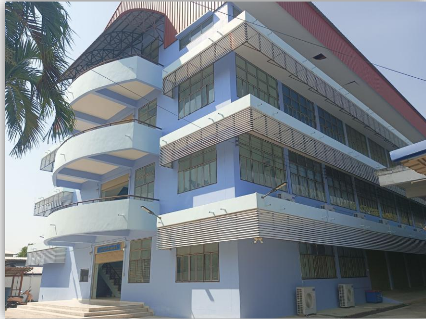
อาคารแผนกวิชาช่างอิเล็กทรอนิกส์