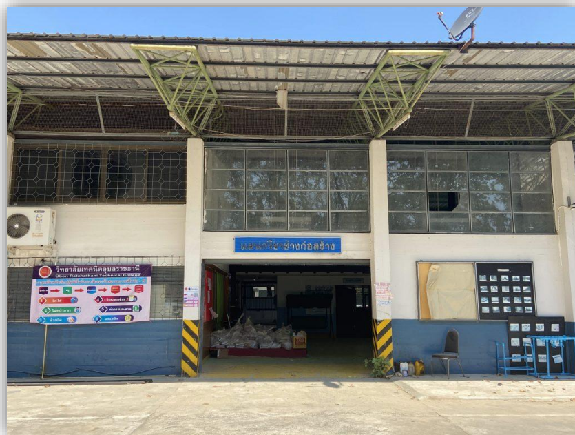
อาคารแผนกวิชาช่างก่อสร้าง/สถาปัตยกรรม