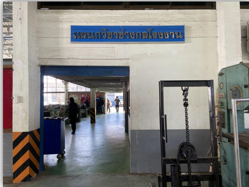
อาคารแผนกวิชาช่างกลโรงงาน