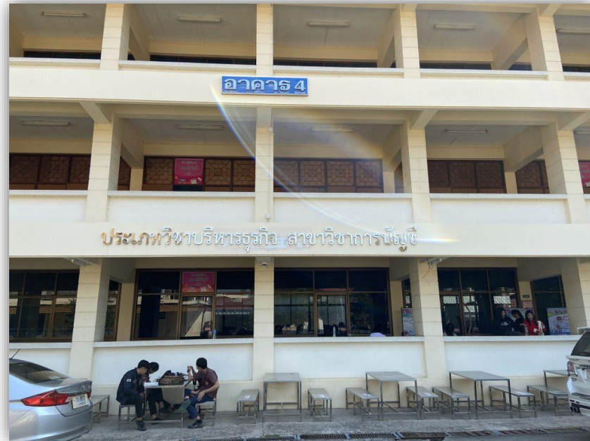
อาคารแผนกวิชาการบัญชี