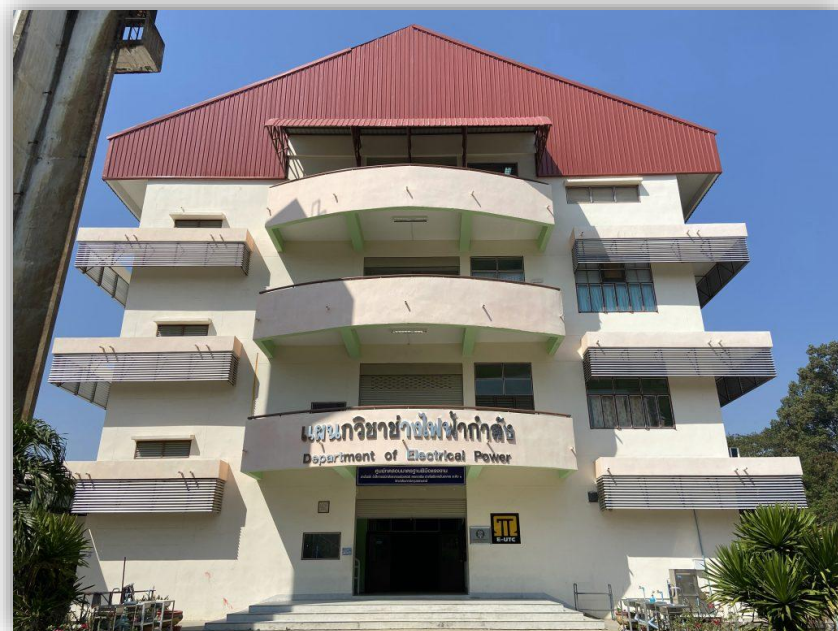
อาคารแผนกวิชาช่างไฟฟ้ากำลัง