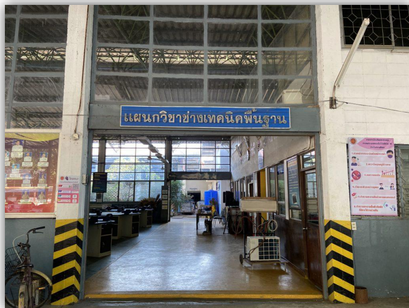
อาคารแผนกวิชาช่างเทคนิคพื้นฐาน