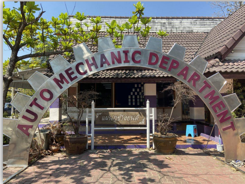
อาคารแผนกวิชาช่างยนต์