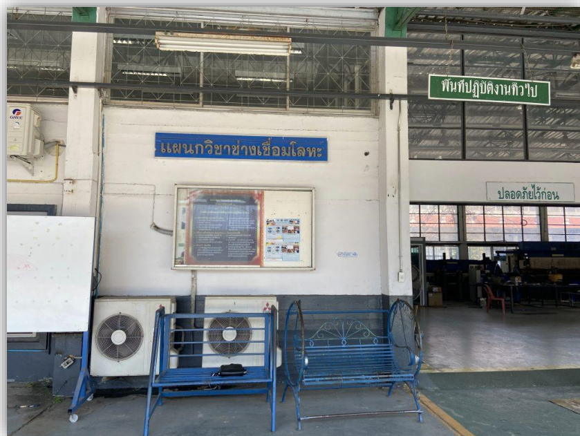
อาคารแผนกวิชาช่างเชื่อมโลหะ