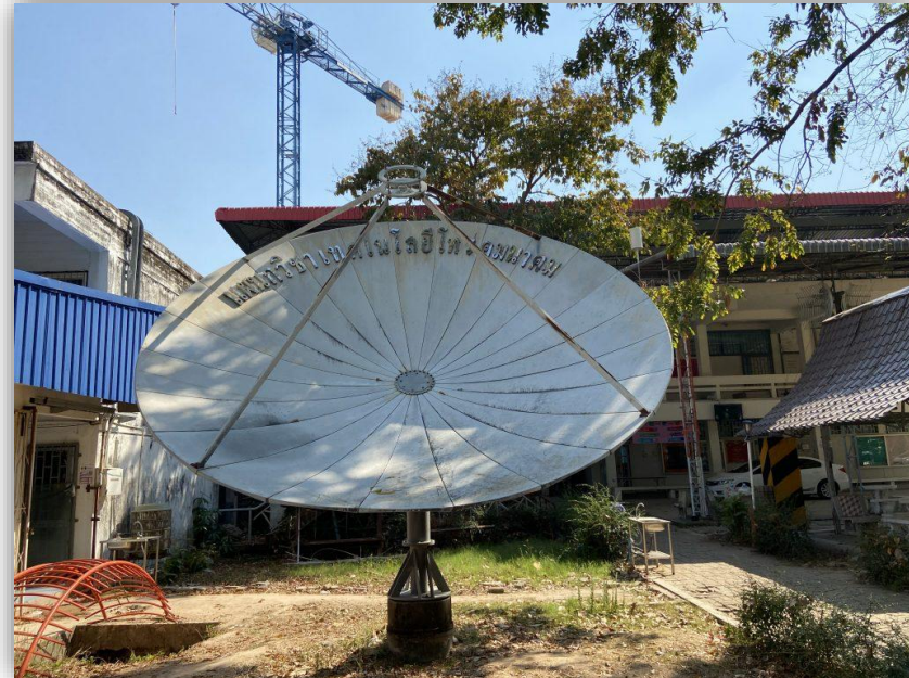
อาคารแผนกวิชาเทคโนโลยีโทรคมนาคม